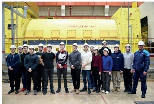
Рис. 2. Студенты кафедры АС и ВИЭ на экскурсии в реакторном и машинном залах энергоблока с реактором БН-800 Белоярской АЭС

Уникальное географическое расположение городов Заречный и Екатеринбург (расстояние между БАЭС и УрФУ примерно 50 км) позволяет активно привлекать специалистов Белоярской АЭС для чтения как отдельных лекций, так и полных курсов, что также повышает вовлеченность студентов в будущую специальность.