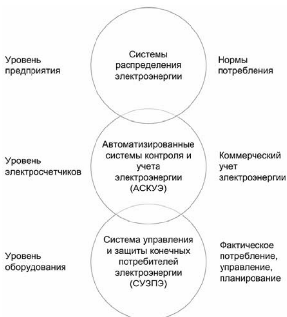
Рис.1. Место и задачи системы управления и защиты конечных потребителей электроэнергии

На рисунке 1 приведена общая схема систем распределения, учета и контроля электроэнергии. На верхнем уровне находятся системы распределения электроэнергии, затрагивающие цепочку от производства (генерации) электроэнергии до потребителя на уровне предприятия (юридического лица). Задача этого уровня – довести качественную электроэнергию до предприятия без сбоев в электроснабжении, снизить вероят-