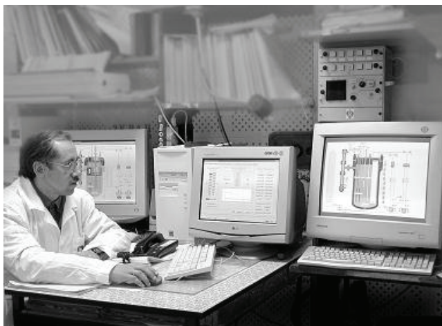
Рис.3. Обработка процесса измерений во время экспериментальных работ на стенде

ных по высоте подъемного участка стенда с шагом 100 мм, в реальном масштабе времени.